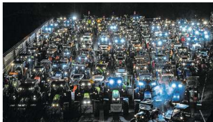
Auch in der Schweiz wächst der Protest. (Schüpbach, 23. 2. 2024)